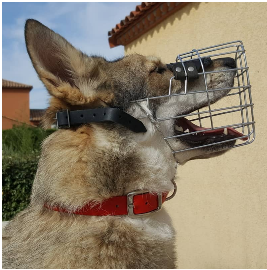
Metalowy kaganiec fizjologiczny dla wilczaka czechosłowackiego - M9